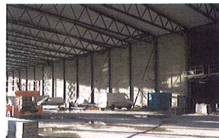
Dette er den andre 100-metersveggen hos Glava AS i Askim.

– Blot leire medførte mye arbeid. Byggegroppen ble spuntet og bygget fundamentert på 300 peler til fjell. Dette er et tilbygg og nytt lager for Glava AS, og går over to etasjer som en forlengelse av eksisterende lagerbygg. Grunnflate i 1. etasje er ca 6 730 m 2 , mens kjelleretasjen har en grunnflate på ca 4 825 m 2 . Vegger i 1. etasje er utført med stålkonstruksjon. Fasader er av tegl, platekledning og sedertre. Innvendige vegger er i pusset Leca og bindingsverk med gips. Bygningen skal stå ferdig i mai, forteller Øyvind Bergersen.